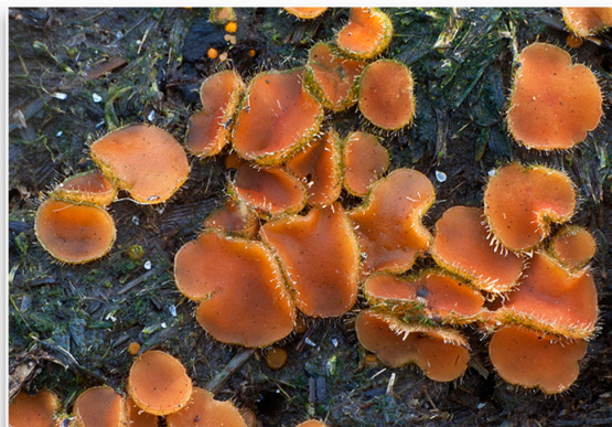
Cheilymenia stercorea (Pers.) Boud., BAR2013070610, a. Ascomas .