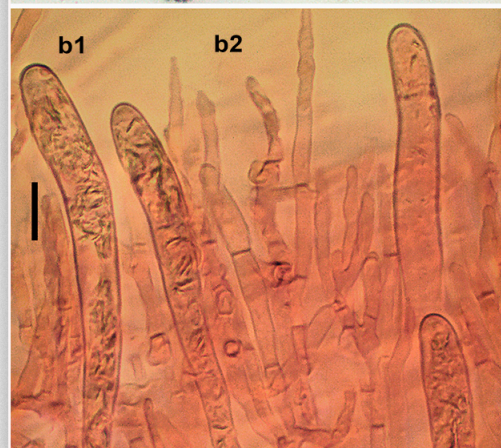
Russula decipiens (Singer) Svrček, BAR2024091702. A. Basidiosporas. B1. Dermatocistidios. B2. Pelos de la Pileipellis . Escala barra = 10 μm.